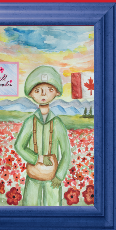
Création de Bonnie Li Onoway, Alb.

Quel type de vidéo puis-je soumettre? Votre vidéo peut être n'importe quoi, du court métrage à l'animation, du moment qu'elle illustre les thèmes canadiens du Souvenir. Votre vidéo pourrait être :