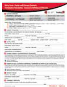
Formulaire d'inscription Un formulaire d'inscription est maintenant obligatoire pour toutes les soumissions aux Concours national du Souvenir pour les jeunes. Format bilingue.