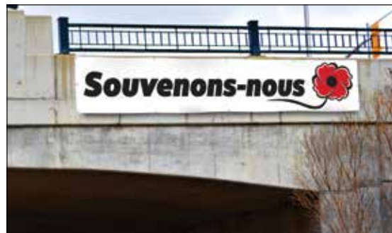
200186 Bannière en vinyle « Souvenons-nous » 4' X 20'