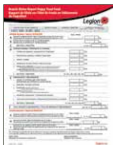
Fonds du Coquelicot - Rapport de filiale Formulaire pour faire le compte-rendu des fonds en fidéicommis du Coquelicot. Format bilingue.