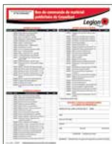
Bon de commande de matériel publicitaire Ce formulaire est nécessaire pour commander tout article du catalogue après de votre direction provinciale.

Matériel publicitaire : Visitez https://www.legion.ca/fr et cliquez sur ACCÈS MEMBRE pour accéder au site Web des Services aux membres. Une fois inscrit(e) , cliquez Ressources – Directions & Filiales , suivi de Coquelicot et Souvenir .