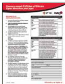
Lignes directrices pour juger Lignes directrices, y compris la feuille de marque, pour juger les Concours national du Souvenir pour les jeunes.