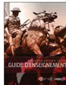
Guide d'enseignement Visitez https://www.legion.ca/fr/communautes-et-jeunes/education-de-la-jeunesse/guide-d-enseignement

Éducation de la jeunesse : Visitez https://www.legion.ca/fr/communautes-et-jeunes/education-de-la-jeunesse/concours-sur-le-souvenir-pour-les-jeunes