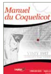
Manuel du Coquelicot Un livret qui contient des renseignements importants pour les présidents de comités du Coquelicot et les membres de leur comité. Une nécessité pour ceux qui veulent mener une campagne couronnée de succès.