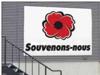
200184 Bannière en vinyle « Souvenons-nous » 9' X 12'