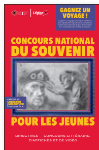
Brochure Éducation de la jeunesse Une brochure contenant toute l'information au sujet du Concours national du Souvenir pour les jeunes

Éducation de la jeunesse : Visitez https://www.legion.ca/fr/communautes-et-jeunes/education-de-la-jeunesse/concours-sur-le-souvenir-pour-les-jeunes