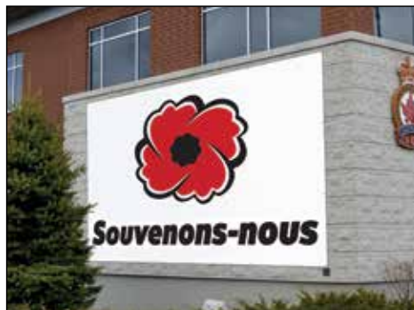
200182 Bannière en vinyle « Souvenons-nous » 15' X 20'