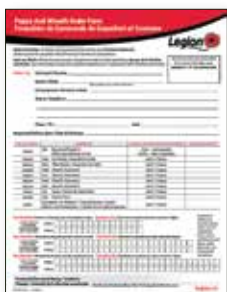
Formulaire de Commande de Coquelicot et Couronne Formulaire servant à commander les coquelicots et les couronnes auprès de la Direction nationale. Format bilingue.