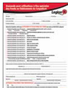
Demande de fonds du Coquelicot à des fins spéciales Formulaire de demande pour utilisation à fins spéciales des Fonds en fidéicommis du Coquelicot (anglais au verso).