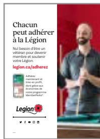
AFFICHE D'ADHÉSION #800392 Français #800391 Anglais

Visitez le site Web des Services aux membres de la Légion pour obtenir ce qui suit et bien plus encore! portal.legion.ca/fr/marketing