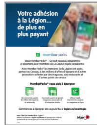
AFFICHE MEMBERPERKS® #800726 Français #800725 Anglais