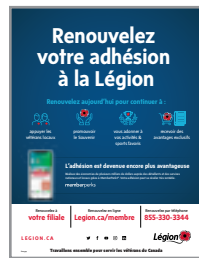
AFFICHE DE RENOUELEMENT #800394 Français #800393 Anglais