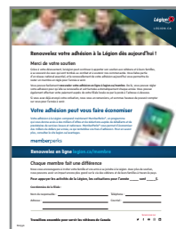
LETTRE DE RENOUELEMENT D'ADHÉSION À IMPRIMER OU NUMÉRIQUE #800396 Français #800395 Anglais