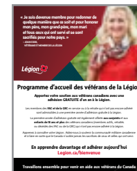
PROGRAMME D'ACCUEIL DES VÉTÉRANS