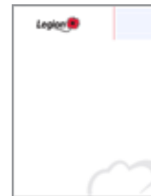
PAPIER À EN-TÊTE