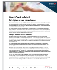
LETTRE DE BIENVENUE AU MEMBRE #800806 Français #800805 Anglais